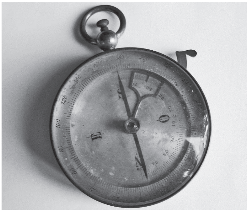
Fig. 1. Bussola geologica acquistata da Giovanni Marinelli per il Gabinetto di Geografia nel 1888

del Gabinetto servissero da supporto, o che fossero utilizzati in occasione di escursioni didattiche: il professore universitario di Geografia, infatti, era chiamato all'uscita sul campo non solo da studioso, ma anche da formatore, e Marinelli stesso riferisce di aver guidato studenti sui Colli Euganei per esercitazioni, anche ipsometriche, utilizzando generici aneroidi di controllo, accanto al suo Fortin (Marinelli, 1920, p. 116).