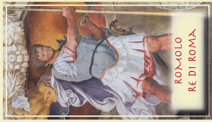
ROMOLO RE DI ROMA