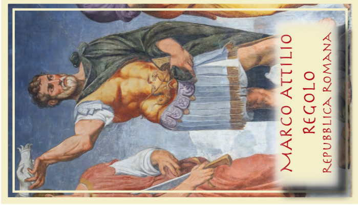
MARCO ATILIO REGOLO REPUBBLICA ROMANA