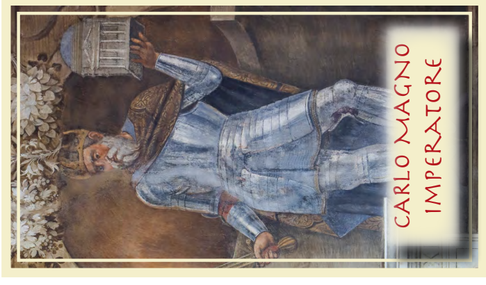
CARLO MAGNO IMPERATORE