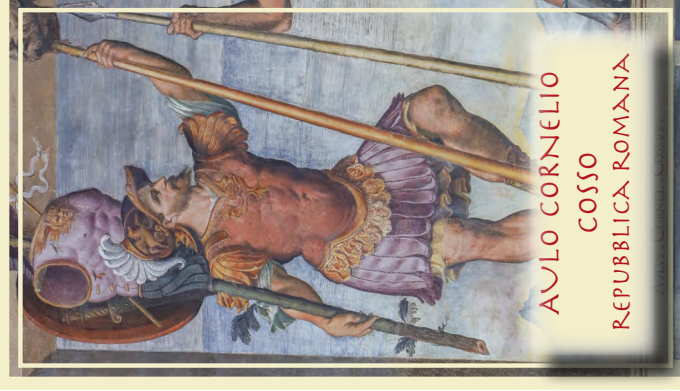
AVLO CORNELIO COSSO REPUBBLICA ROMANA