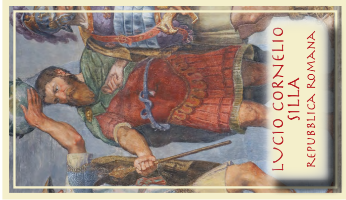
LUCIO CORNELIO SILLA REPUBBLICA ROMANA