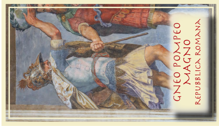
GNEO POMPEO MAGNO REPUBBLICA ROMANA