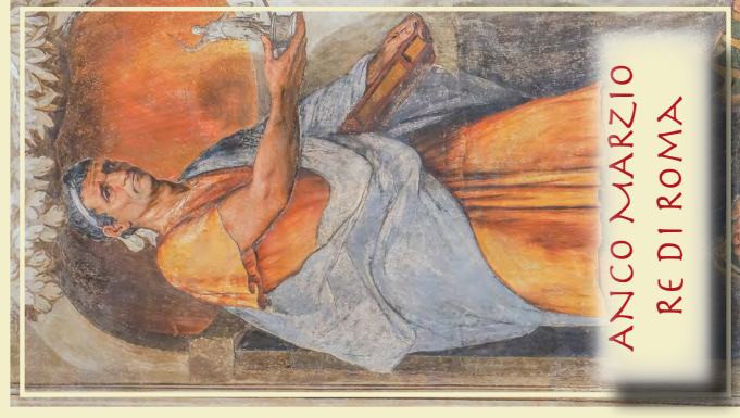
ANCO MARZIO RE DI ROMA