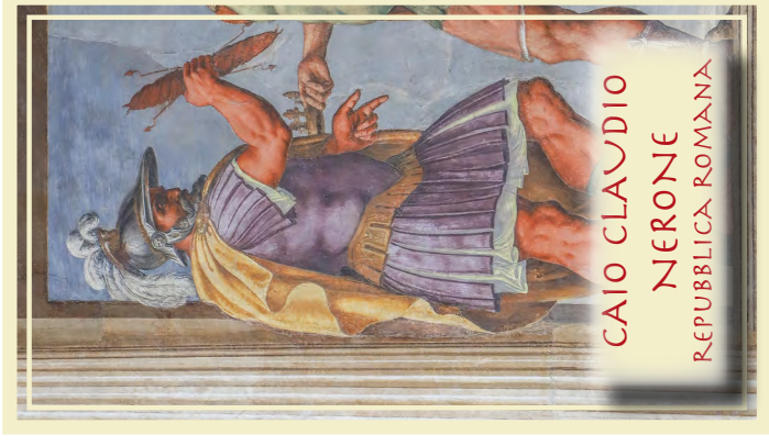
CAIO CLAUDIO NERONE REPUBBLICA ROMANA