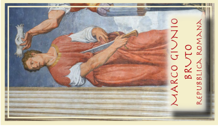
MARCO GIUNIO BRUTO REPUBBLICA ROMANA