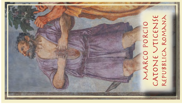
MARCO PORCIO CATONE UTICENSE REPUBBLICA ROMANA