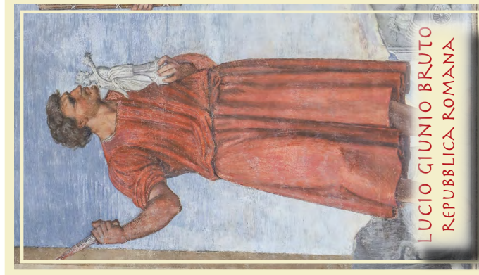
LUCIO GIUNIO BRUTO REPUBBLICA ROMANA