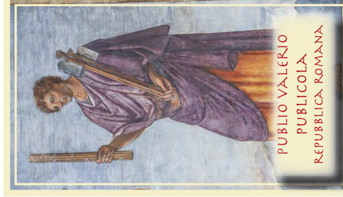
PUBLIO VALERIO PUBLICOLA REPUBBLICA ROMANA