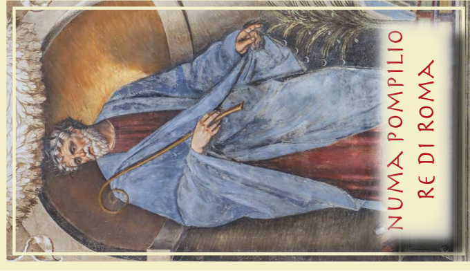
NUMA POMPILIO RE DI ROMA