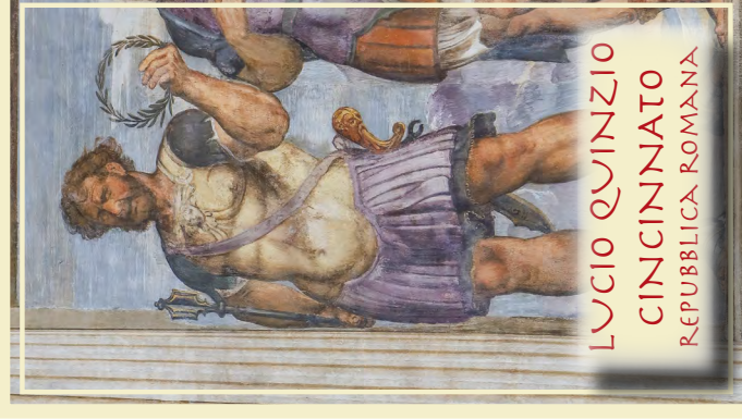
LUCIO QUINZIO CINCINNATO REPUBBLICA ROMANA