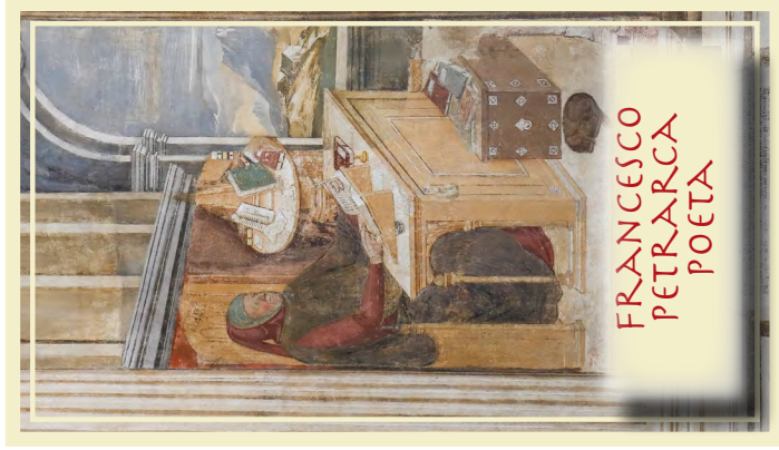
FRANCESCO PETRARCA POETA