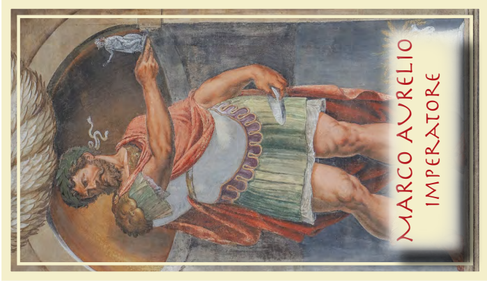
MARCO AURELIO IMPERATORE