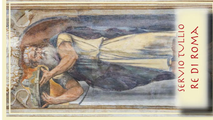
SERVIO TULLIO RE DI ROMA