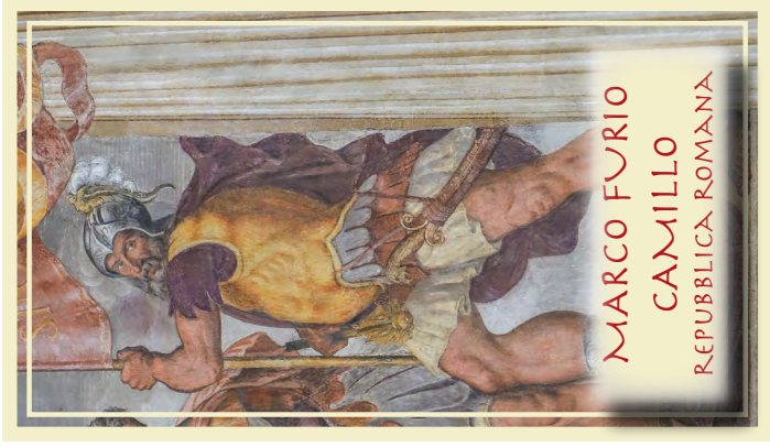
MARCO FURIO CAMILLO REPUBBLICA ROMANA