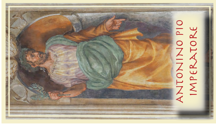
ANTONINO PIO IMPERATORE