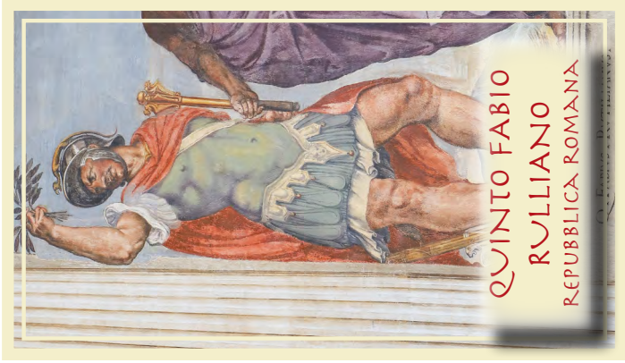
QUINTO FABIO RULLIANO REPUBBLICA ROMANA