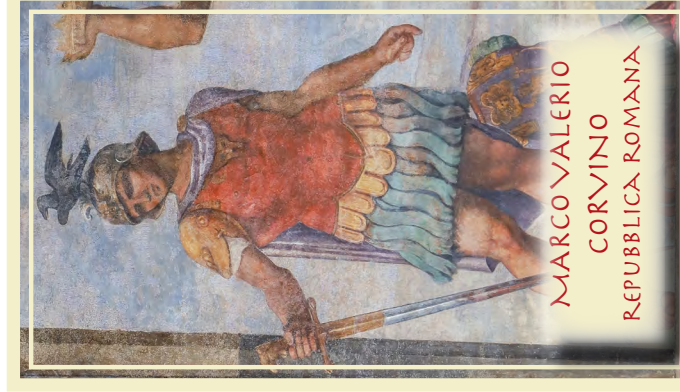
MARCO VALERIO CORVINO REPUBBLICA ROMANA