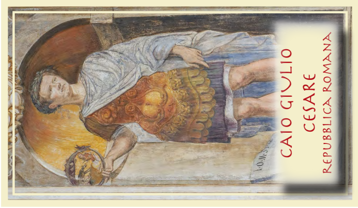
CAIO GIULIO CESARE REPUBBLICA ROMANA