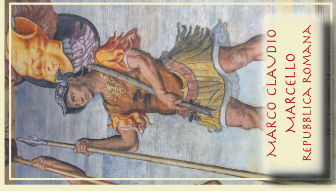
MARCO CLAUDIO MARCELLO REPUBBLICA ROMANA