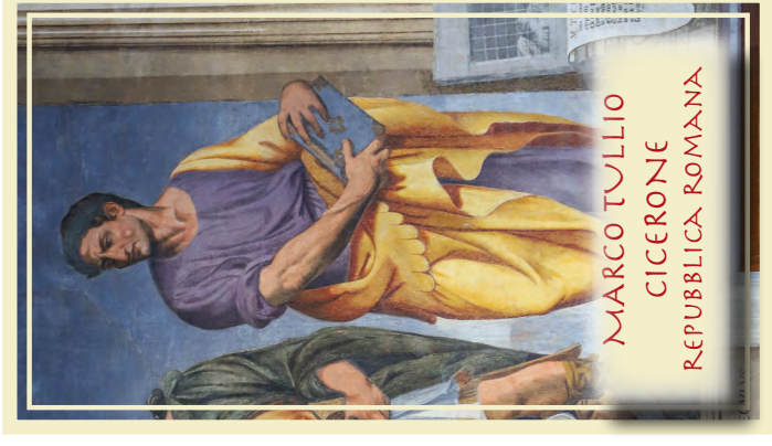
MARCO TULLIO CICERONE REPUBBLICA ROMANA