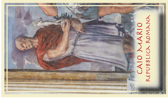
CAIO MARIO REPUBBLICA ROMANA