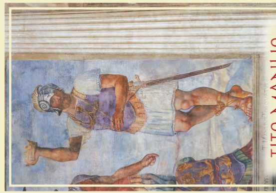
TITO MANLIO TORQUATO REPUBBLICA ROMANA