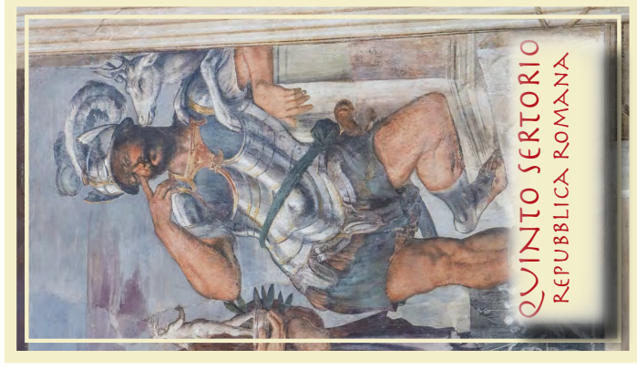
QUINTO SERTORIO REPUBBLICA ROMANA