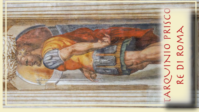
TARQUINIO PRISCO RE DI ROMA