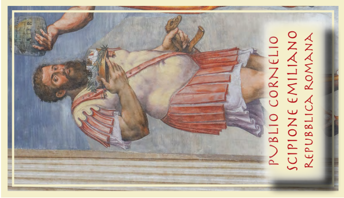
PUBLIO CORNELIO SCIPIONE EMILIANO REPUBBLICA ROMANA