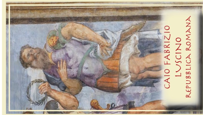
CAIO FABRIZIO LUSCINO REPUBBLICA ROMANA