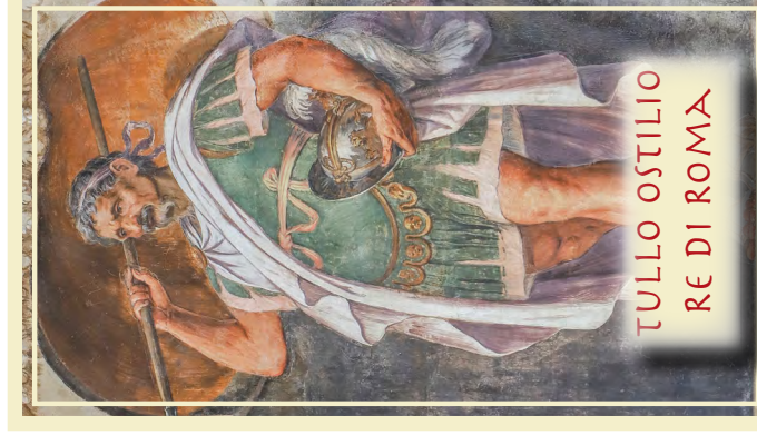
TULLIO OSTILIO RE DI ROMA