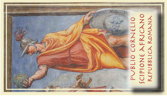
PUBLIO CORNELIO SCIPIONE AFRICANO REPUBBLICA ROMANA