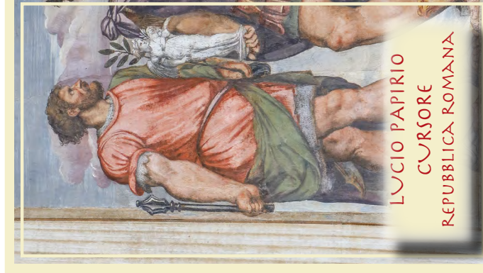
LUCIO PAPIRIO CURSORE REPUBBLICA ROMANA