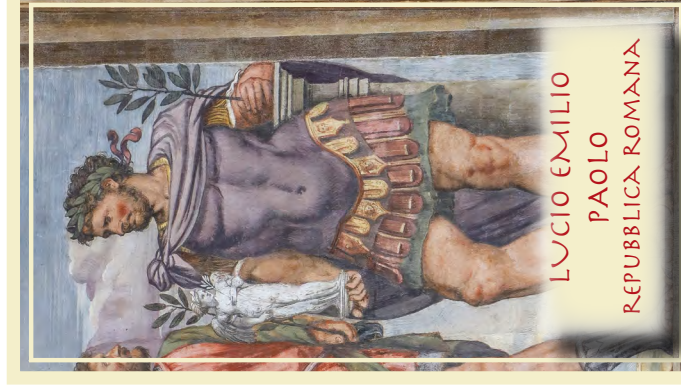
LUCIO EMILIO PAOLO REPUBBLICA ROMANA