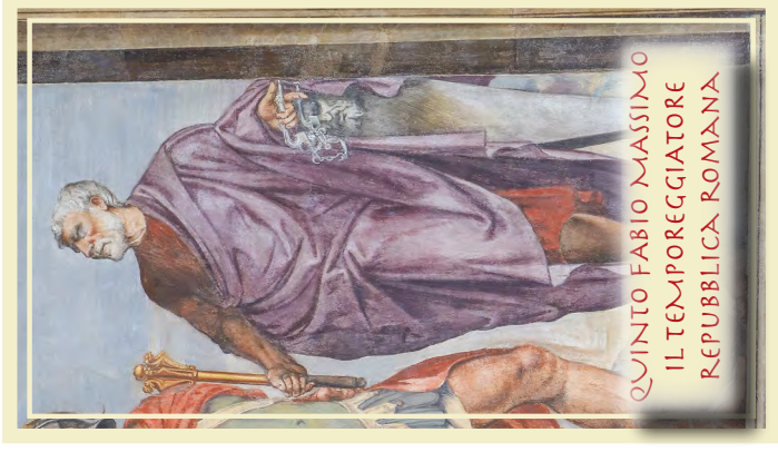
QUINTO FABIO MASSIMO IL TEMPOREGGIATORE REPUBBLICA ROMANA