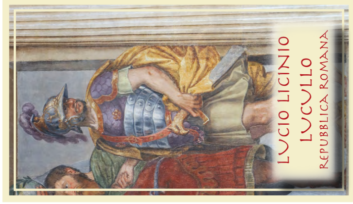
LUCIO LICINIO LUCULLO REPUBBLICA ROMANA