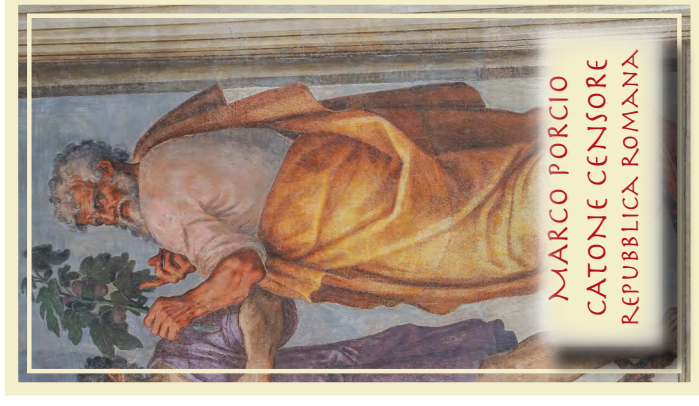
MARCO PORCIO CATONE CENSORE REPUBBLICA ROMANA