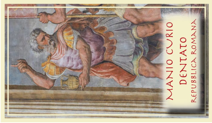
MANIO CURIO DENTATO REPUBBLICA ROMANA