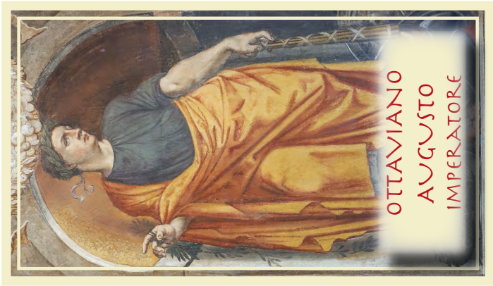
OTTAVIANO AUGUSTO IMPERATORE