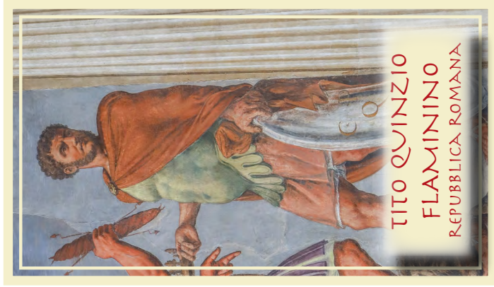
TITO QUINZIO FLAMINIO REPUBBLICA ROMANA